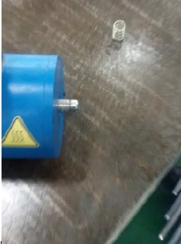
步骤 1: 用一字螺丝刀拆掉卡簧和弹簧