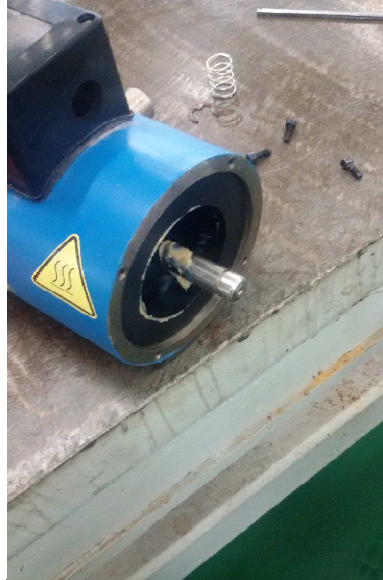
步骤 8: 顶杆上也稍微抹点润滑油