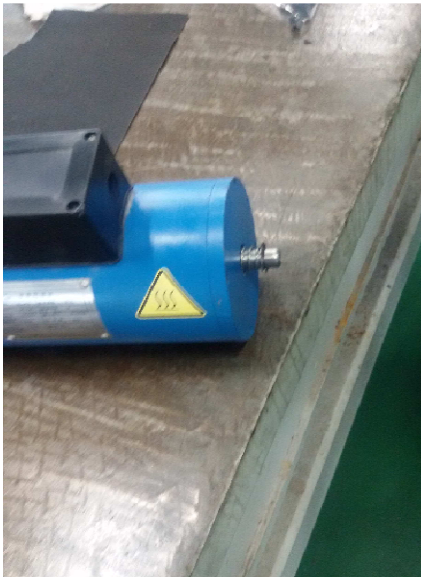
步骤 10: 把弹簧和卡簧装好, 完成作业。再检查一下开闸间隙, 若需要请调整, 参照调整指导书。