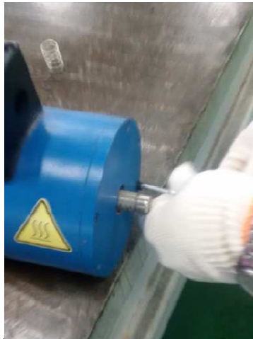
步骤 2: 用 4#内六角扳手拆下端盖上的螺丝