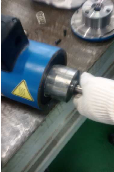
步骤 7: 将抹好润滑油的动铁芯装回去