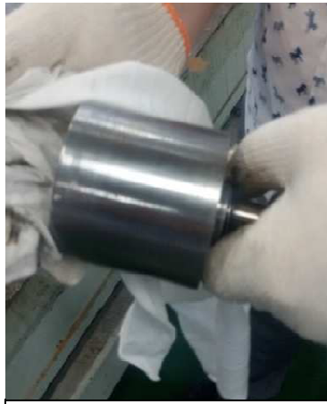
步骤 5: 用干净抹布把动铁芯擦干净, 若有锈蚀及污垢的, 用西砂纸打磨干净