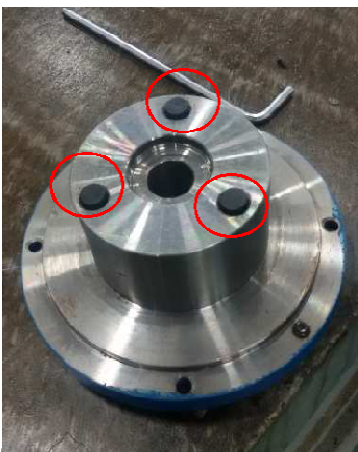
步骤 4: 取下端盖, 看三个橡胶静音柱有无磨损, 若有全部