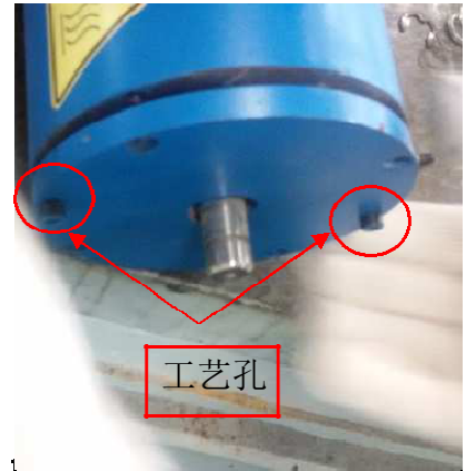
步骤 3: 若端盖紧拿不出来, 可以把拆下来的 M5 的螺丝利用工艺孔顶出来