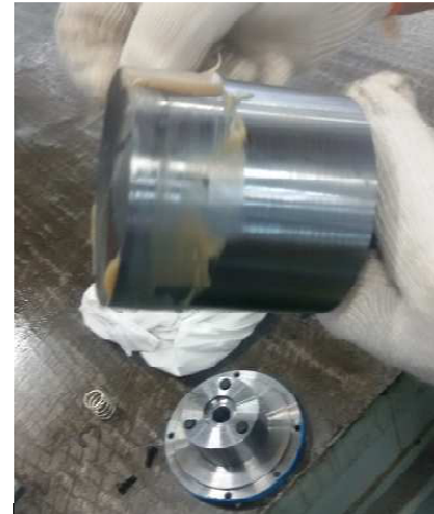
步骤 6: 润滑油均匀涂在铁芯端头衔铁部分, 锈蚀严重的整铁芯涂一层薄的润滑油